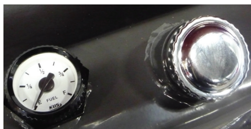
Tartálszint kijelző műszer.