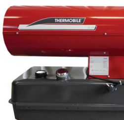
TA 40 (TH) és TA 80 (TH) szintmérővel van felszerelve.