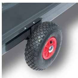
Opcionális lég fúvott kerekek.